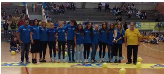
1° CLASS. UNDER 18 FULGOR