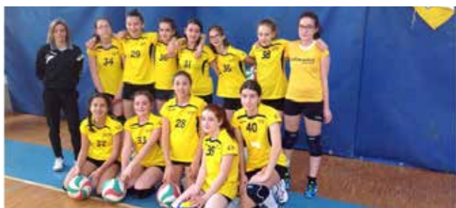
1° CLASS. UNDER 13 YELLOW BROGLIANO