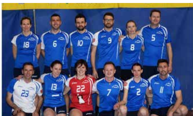
1° CLASS. MISTO GS ANTARES VERDE

Campionato Provinciale Si è conclusa la stagione 2015-16 con il lungo week-end delle finali che si sono svolte a Valdagno e a Novale con le prime partite giovedì 05 maggio, proseguendo il sabato pomeriggio e concludendosi domenica 08 maggio con l'ultima finale in programma. Un particolare ringraziamento va alla società Sporting Alto Vicentino e ai loro dirigenti per aver messo a disposizione le strutture sportive in ottime condizioni per le finali. Ringraziamo inoltre la presenza