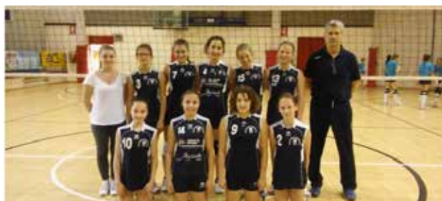
1° CLASS. UNDER 14 PALLAVOLO ARZIGNANO