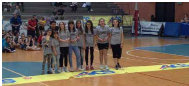
1° CLASS. UNDER 12 SPORTING ALTO VICENTINO