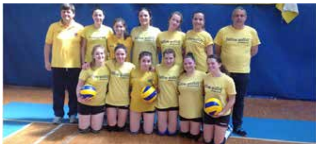
1° CLASS. UNDER 16 YELLOW BROGLIANO