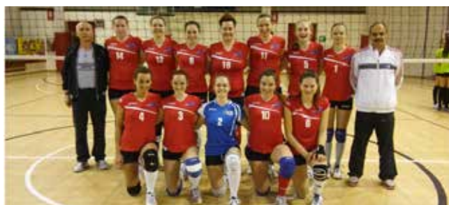
1° CLASS. OPEN SPORTING ALTO VICENTINO