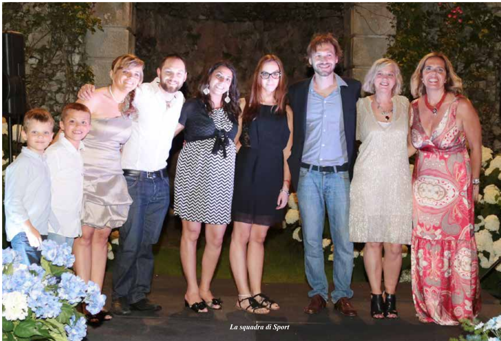
La squadra di Sport