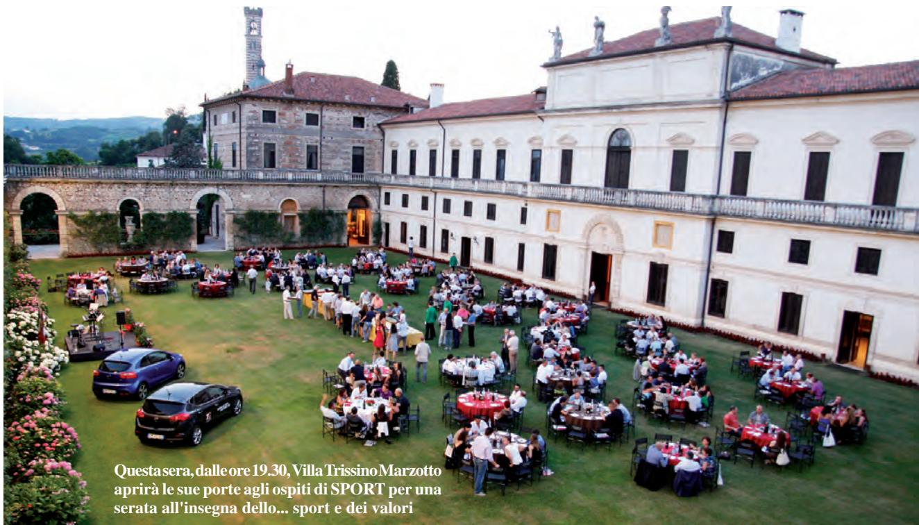
Questa sera, dalle ore 19.30, Villa Trissino Marzotto aprirà le sue porte agli ospiti di SPORT per una serata all'insegna dello... sport e dei valori

Nella splendida cornice di villa Trissino a Marzotto il tradizionale appuntamento con tanti ospiti illustri