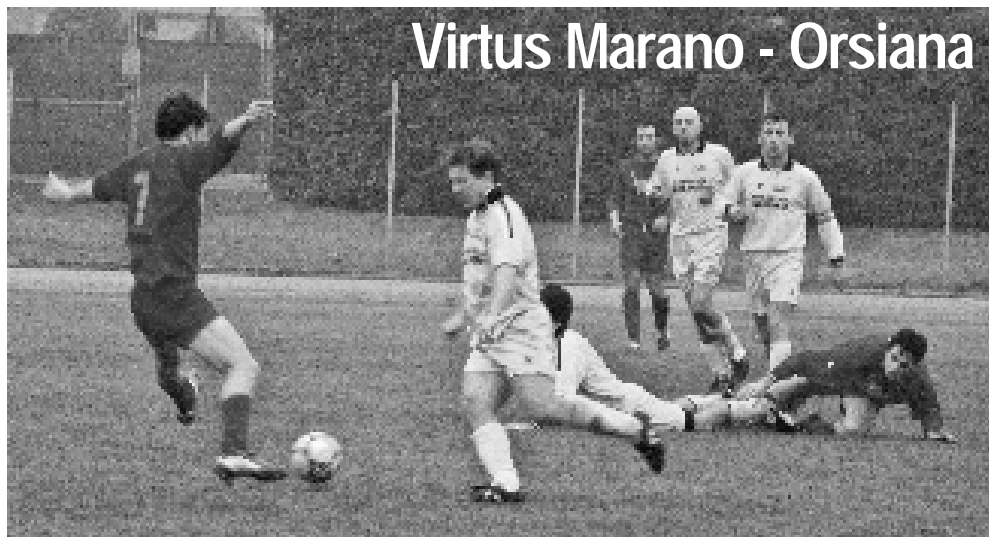
Virtus Marano - Orsiana